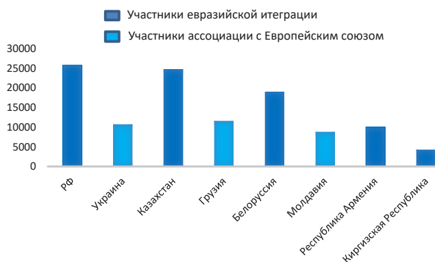
Рис. 1. ВВП на душу населения (ППС) государств — участников ЕАЭС и членов ассоциации с Европейским Союзом в 2014 году, долл. США

Вместе с тем, Российская Федерация, в отличие от СССР, не осуществляет финансовые дотации странам СНГ, поэтому в условиях постоянного бюджетного дефицита, отсутствия финансовой базы для суверенитета они вынуждены были получать ставящие их в политическую зависимость кредиты МВФ и других западных финансовых институтов. В результате одинаковый с Россией на момент распада СССР уровень жизни в его бывших республиках к 2014 году стал существенно ниже российского. В таких условиях страны СНГ осуществляли свой геостратегический (евразийский или европейский) выбор (см. рис.1).